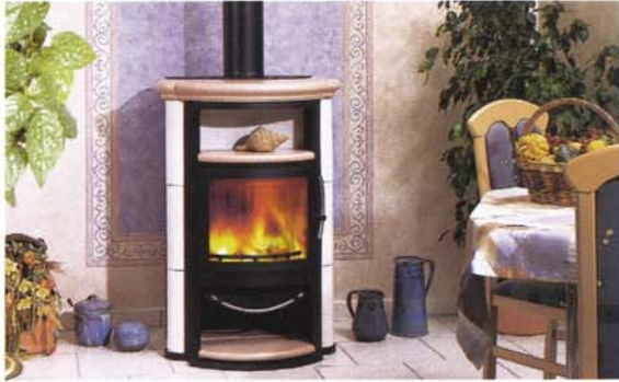
▲ „Ancona Aqua“

tionellen Kaminöfen werden somit zu den 100 % Raumwärmeleistung zusätzliche 50 % für die Wasserseite dazugewonnen und dies ohne zusätzlichen Holzeinsatz. Deutlich wird dies bei einer Messung der Abgastemperatur am Abgasstutzen: Sie sinkt bei einem Aqua-Kaminöfen von ca. 340°C auf etwa 245°C. Diese aus dem Abgas gewonnene Energie wird dem Heizkreis zugeführt. Der Anteil der Heizleistung über die Wasserseite steigt mit der Brenndauer an. Um die Wärmeverteilung optimal regeln zu können, sind ein Temperaturregler und ein Thermostatregler nötig.